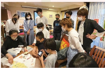
『対話の食卓』の様子

「よるのがっこう」では、『対話の食卓』で10代と大人が「夜」という特別な時間帯に集い、毎回、面白いテーマで活動を企画します。また、東京ガレージ主催の、10代～大人を対象とする『ホンモノ体験』とも連動します。10代の子もたちと年の近い荒川区の若手職人やアーティスト、専門家と一緒に本気で挑むワークショップは好評です。今までに、それぞれの専門家とともに、のれんや提灯、製額や江戸木版画、アートや即興劇などを体験しました。