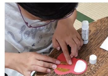
敬老の日の色紙飾りづくり体験中!