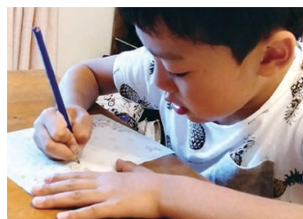
施設で暮らす高齢者の方と お手紙交換(文通)プログラム!