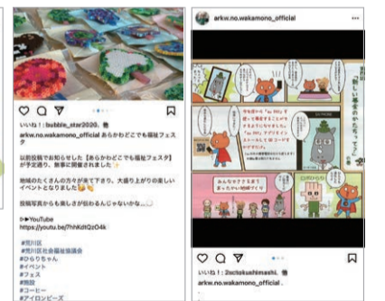
社協の取り組みについても、若手職員目線で発信しています。