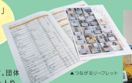
つながるリーフレット

ボランティアフェストVol.13は、そんな新しい「つながり」が生まれ、地域の活動が楽しく豊かになることを期待しながら開催します!