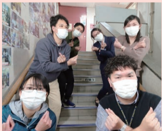
担当メンバーはこんな顔ぶれです!

荒川に在住または在学・在勤の若者や荒川という地域やそこでの活動に興味・関心のある若者同士がつながり、地域が楽しい!わくわくする!そんな地域愛に溢れた若者を増やすことを目標に、若者による活動の企画や運営をしています。