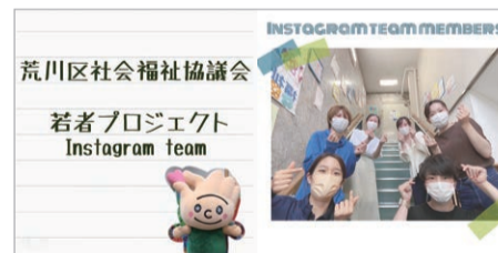
Instagramの投稿は、SNS世代の若手職員が担当しています!

アカウント▷荒川区社会福祉協議会若者PT arkw.no.wakamono_official