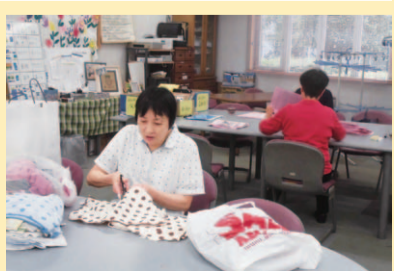
▲布切り(ウエスづくり)作業