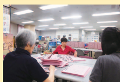
▲季刊紙「あしあと」折り作業

ボランティアを始めて17年になります。長く接していると、利用者さんが本当に愛おしく思え、休んでいたりすると気がかりです。まずは、利用者さんに会ってほしいです。知り合いの人がいたら是非一緒に足を運んでほしいです。ボランティアというのは、利用者さんのためかと思うかもしれないけど、実は自分のためが一番大きいんです。途中、辞めようと思ったこともありますが、ペースを落として今に至っています。こんなものでもいいのかしらと思うようなことでも喜んでもらえるから嬉しいです。