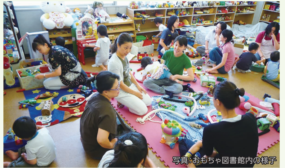
写真:おもちゃ図書館内の様子