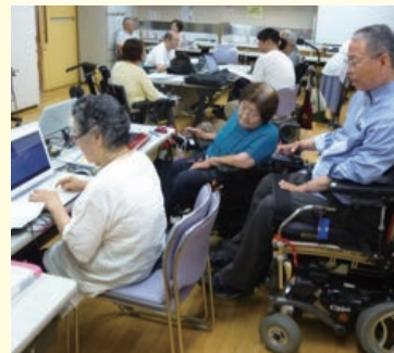
パソコン教室の様子