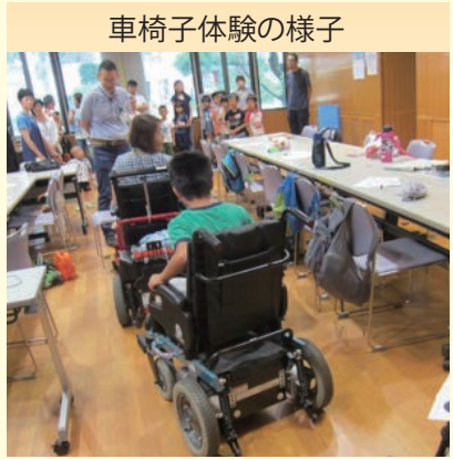
車椅子体験の様子

そうですね。これからも、もっともっと自分たちの意思をはっきりと伝えていきたいです。ここまで先人の方々がやって来てくださいました。今、我々が後に続く方たちに残していかなければならないことがあると思います。今は公共施設のバリアフリー化も進み、ヘルパーさんも増えて生活面で苦勞することは減ってきました。それでも、民間施設では階段があつてお店に入れなかったり、車いす用トイレがなかったりとまだまだ我慢している人が沢山いると思うので、我々が声を出し続けていかなければいけないと思います。