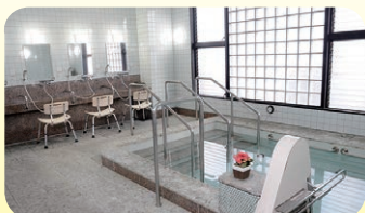
▲ 荒川東部サービスセンター浴室