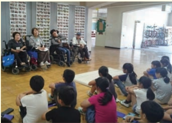
小学校で行われた福祉学習