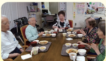
▲ 栄養バランスの採れた食事