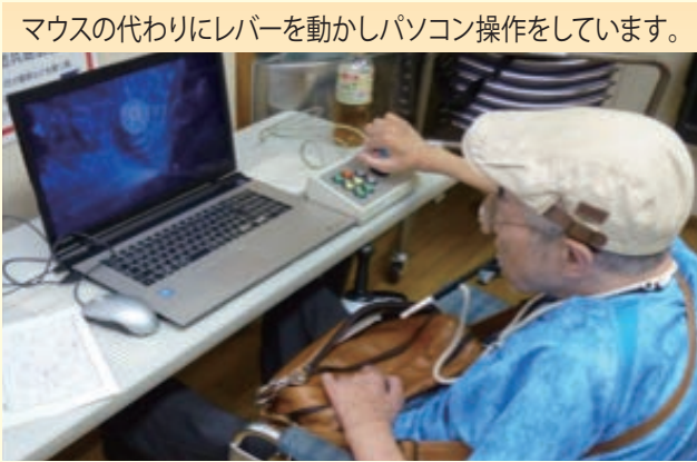
マウスの代わりにレバーを動かしてパソコン操作をしています。