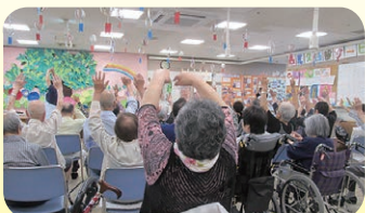
▲ 集団体操で筋力を落とさない