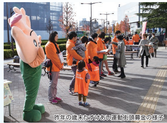
昨年の歳末たすけあい運動街頭募金の様子

※本運動による募金は、所得税、地方税、法人税の控除対象となります。詳細は、最寄の税務署、または、共同募金会などへお問合せください。