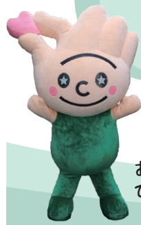
お豆大好き ひらりちゃん