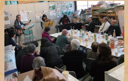
▲クリスマスミニコンサートの様子

東日本大震災により荒川区に避難をされた方を応援するため、平成24年3月に発足した「町屋6丁目避難者ミニサロン」は現在、荒川社協の本部で「ふるさとサロン」として、月に1回開催しています。このサロンでは、ふれあいポリスの防犯情報や福島県や宮城県から派遣されている職員の支援情報の他、演奏会や南京玉すだれ等の季節の催し。美容師の方の理髪もあり、避難者の方々が荒川区で生活していくうえで必要な情報入手や生きがいづくりの場となっています。