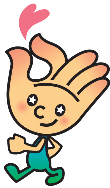
ひらりちゃん 荒川社協キャラクター