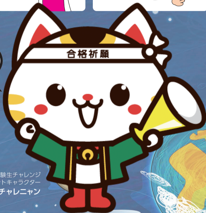
受験生チャレンジ マスコットキャラクター チャレニャン

塾の費用・受験料を 無利子で貸りられます。 高校・大学等に入学すると 返済が免除されます!