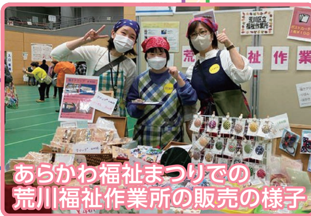
あらかわ福祉まつりでの荒川福祉作業所の販売の様子