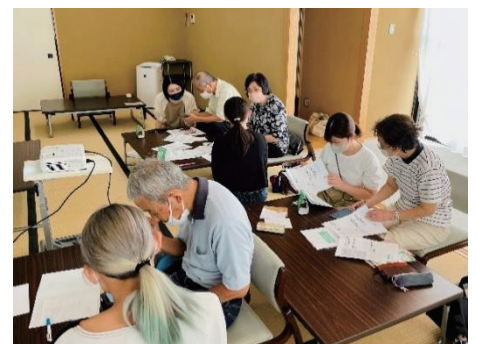
※写真は昨年度の様子です

TEL: 3802-3338 FAX: 3802-3831 メール: vorasen@arakawa-shakyo.or.jp