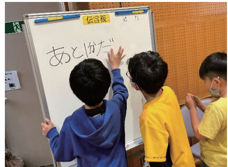
※写真は昨年度の様子です

TEL: 3802-3338 FAX: 3802-3831 メール: vorasen@arakawa-shakyo.or.jp