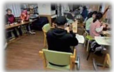
食事の様子。子どもから大人まで一緒に食事をします。

【問合せ】一般社団法人 子ども村ホッとステーション 荒川区町屋 2-21-2 フレスコ町屋 201 TEL : 03-6240-8571