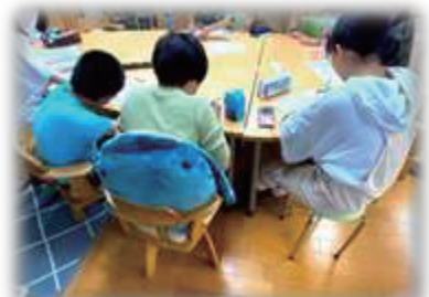
学習中。集中の仕方が人それぞれで面白い!