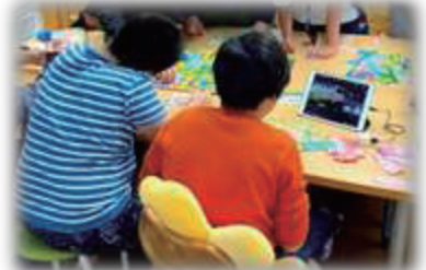
皆で人生ゲームを楽しみました!