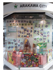
昨年の区役所1階ロビー展示の様子

障害者週間にあわせ、 区役所1階ロビーで、 区内障害者施設の利用者による作品展示を行っています。 展示期間は 11/27(月)～ 12/8(金)です。 区役所に来庁された際は、 ぜひお立ち寄りください。