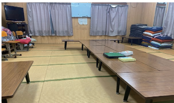
町会会館2階にある和室を使って子どもたちが遊べるスペースに、オセロやトランプ等の遊び道具も。(西文化会館)

『子どもの時間』を作ろう と思ったきっかけは？ 「子ども食堂を作りたい」という思いがあり、昨年からは、社会福祉協議会の地域福祉コーナー「デイネーター」と相談をしていました。そのなかで、もともと地域で活動していた『サロン西文化』を手伝っている時に、たまたま子どもが遊びに来てくれたことがありまして。そこから、子どもが遊びに来れるようなサロンがあったら面白いのではという話になり、まずはサロン(『子どもの時間』)を作ってみようとなったところから始まりました。