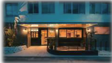
カフェ・ダイナーの外観。とてもオシャレ!! バリアフリーデザインで誰でも入りやすい!

【問合せ】NPO法人 TOKYO L.O.C.A.L 〈カフェ・ダイナー〉 荒川区町屋1-3-12 TEL: 03-6807-7748