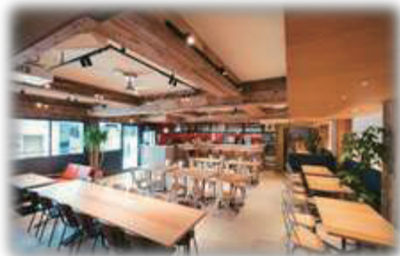
店内もオシャレ! 地域イベント等を実施しています。