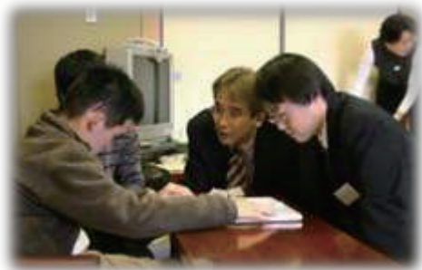
←療育事業で将棋を教えている様子。

(※2)ピアサポート：同じ問題や環境を体験する人が、対等な関係性の仲間で支え合うこと。