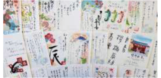
《高齢者から届いたお礼状》

など子どもたちへの励ましの言葉もいただきました。この年賀状が子どもたちと高齢者との交流のきっかけとなることを願っています。