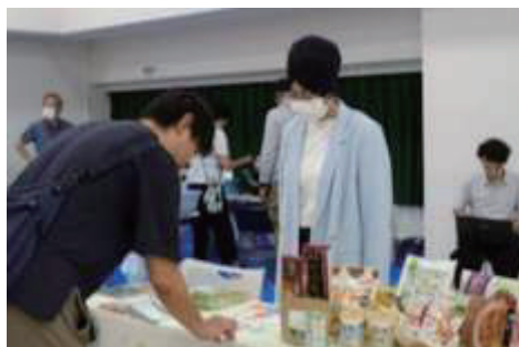
←←← 昨年度の活動 見本市の様子

文京区・台東区・北区・荒川区(城北ブロック)でボランティア活動をする団体がブース出展します。