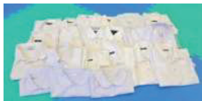
たくさんの 白Yシャツ。 現在 452 枚！