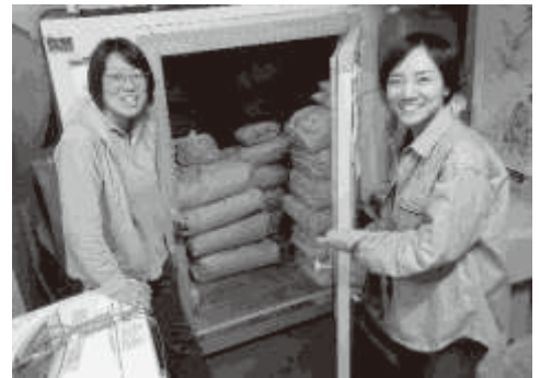
群馬県館林市の農家で田んぼを借りて米づくり。写真は秋に収穫したコメと。

路上生活をしている人たちが必要としていることをやろうと、2000年から食を支える「フードバンク」、2001年から医療を支える「隅田川医療相談会」を続けてきました。2013年には、人手不足の解消と居場所づくりを目指して、合分でフードバンクの仕分けをする「共同作業日」を始め、それをきっかけとして2019年にフードバンクと相談会が統合、「一般社団法人あじいる」が誕生しました。法人格をとってから、「資源回収」を始めました。また、年配の仲間の人生語りを冊子にして社会へ発信する「あしあとプロジェクト」にも取り組んでいます。