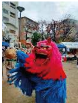
←ひと・もの・くらし あらかわ再発見 昨年度開催時の様子