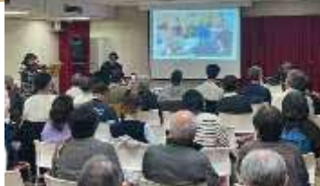
能登支援活動報告の様子