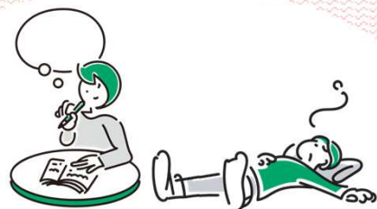
自分のペースで過ごす