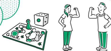
ゲーム・体操など

主催 荒川区 問合せ 荒川区社会福祉協議会 福祉サービス課 地域福祉支援係 電話03-5604-5863 FAX03-3891-5290 メールgorolink@arakawa-shakyo.or.jp