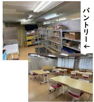
パントリー ブランチルーム

新たなスペースとして、1階には食材等を保管する「パントリー」と小さな講座や打合せ、作業等が行える「ブランチルーム」が、2階には音楽演奏や大人数でのイベント開催が可能な「多目的ホール」ができました。今後、様々なかたちでボランティア活動を広めていきます。