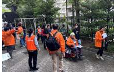
昨年度のユニバーサルウォークの様子

子どもから高齢者・障がいのある人もない人もみんなで一緒に交流しながら「防災」をテーマに歩くウォークラリーです。今回は日暮里地区(日暮里駅周辺)を歩きます。お一人でも、ご家族・ご友人とでもぜひご参加ください。