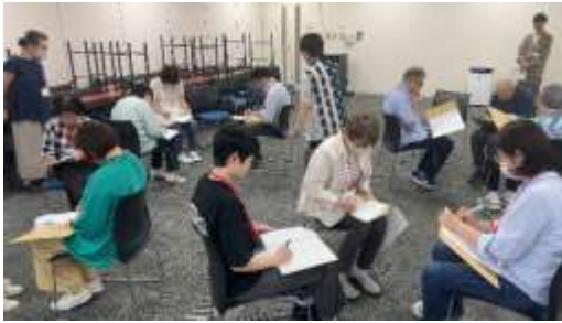
昨年度の講座の様子

「あらんてあ」とは、あらかわのボランティアの造語です。 荒川区内を中心としたボランティア活動の情報やイベント情報、助成金の情報を提供しています。